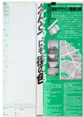
模造紙「(仮) 下代田公園計画案づくりのこれまでの成果」1996年 製作：財団法人世田谷区都市整備公社まちづくりセンター

応募用紙「世田谷清掃工場新設煙突 色彩デザイン提案公募」1988年 発行：世田谷区