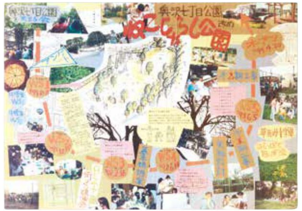
パネル「ねこじゃらし公園オープンまでの道のり」 1994年 製作：七月工房