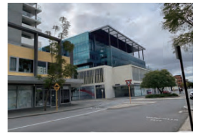
ピア・ストリート 3階部分からセットバックされた高層建築の様子