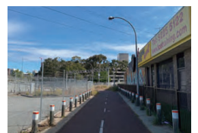
アバディーン・ストリート横の路地の様子