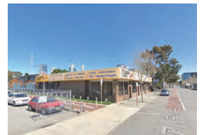
アバディーン・ストリート 低層建築の様子