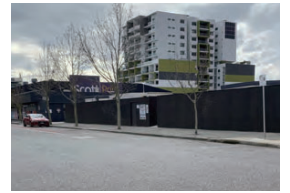
アバディーン・ストリート 奥まって建てられた高層建築の様子