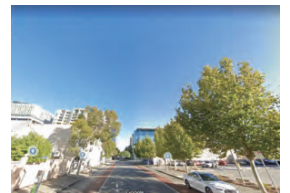
開放的な上空と周囲の建築物に高さがそそえられた街路樹の様子