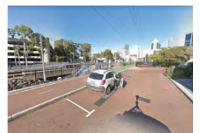
線路に隣接する細いストリートの様子